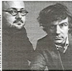
IMAGINATION WITTELSPAIN GILLOCK, NORA PAVONI AND MONICA VARGAS AND SANDRICK FILMS PRODUCTION 2008