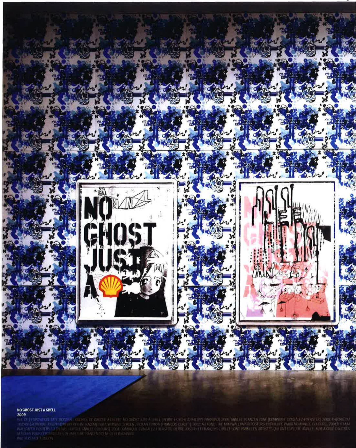
NO GHOST JUST A SHELL 2009

VUE DE L'EXPOSITION DATE MOISSON, LOUVERIS, DE GAUCHE À DROITE : NO GHOST JUST A SHELL (PIERRE HODIER & PHILIPPE PARRENCO, 2009), ANKLE IN ANZEL ZONE (DOMINIQUE GONZALEZ-FOERSTER, 2000), THÉORIE DU TRONÇONNÉ (MIRIAM JOSEPH & ANITA HAN RACEM), SANS WITNESS SCREEN / ÉCRAN TÉMOIN (FRANÇOIS CLAUET), 2002, ALL'ONTO, THE MAN WALLPAPER POSTERS II (PHILIPPE PARRENCO/ANITA COLLEURS), 2001, THE MAN WALLPAPER POSTERS I, LA TUN, HANNA, ANITA COLLEURS, 2001, DOMINIQUE GONZALEZ-FOERSTER, PIERRE JOSEPH ET FRANÇOIS CLAUET SONT INSCRITES ARTISTES QUI ONT EXPLOITÉ ANKLE, MAN À CRÉY, D'AUTRES AFFICHES POUR CERTAINES DES ŒUVRES SONT DISPONIBLES SUR LE SITE PERSONNEL DE CHACUN D'EUX. PHOTOLOGIE TAD, TURKIN