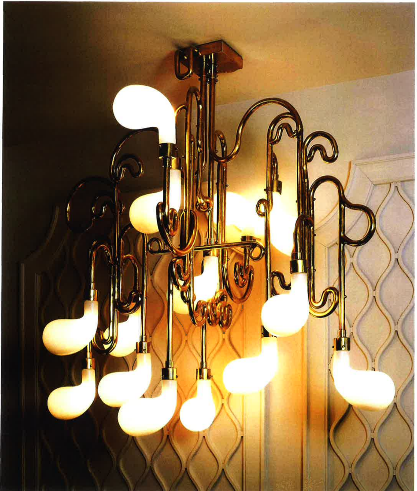
CHANDELIÈRE - RESTAURANT THOUMIEUX - PARIS 2010