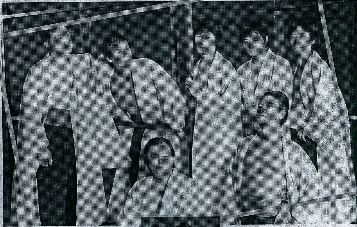
◇연극 '귀족놀이'에는 프랑스 스태프들이 참여하고, 한국 국립극단의 젊은 배우들이 출연한다.