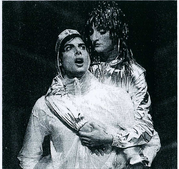
... Où boivent les vaches : Roland Dubillard y pousse loin le questionnement sur le statut de l'artiste.