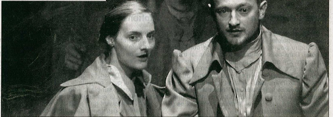
Une image de la pièce créée par Éric Vigner, en médaillon.

- Brest, grand théâtre du Quartz, samedi 17, lundi 19, mardi 20, mercredi 21 octobre, à 20 h 30. Rens. 02 98 44 10 10.