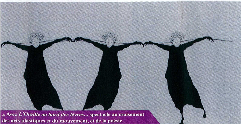
▲ Avec L'Oreille au bord des lèvres... spectacle au croisement des arts plastiques et du mouvement, et de la poésie

Pour tous ceux qui suivent régulièrement les propositions du CDDB, ils auront le plaisir de retrouver les fidèles complices du théâtre, les six du « Club des Auteurs » (des auteurs qui proposent des lectures et jeux d'écritures depuis trois ans) ainsi que les artistes associés, qui auront la part belle dans cette programmation.