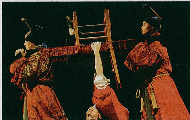
L'Oratorio d'Aurélia à l'Opéra municipal.