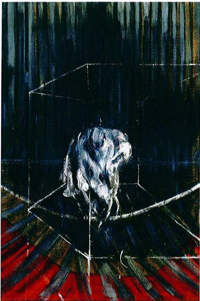
Francis Bacon Sans titre (nu recroquevillé)